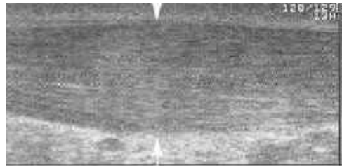
Afbeelding van een diffuus, spoelvormige verdikte Achillespees. ( tussen de witte pijlen) De grootste zwelling bevindt zich doorgaans enkele centimeters boven de calcaneus