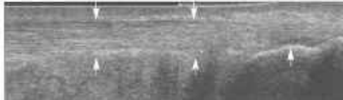
Afbeelding van een normale Achillespees bij echografie. De pees heeft een strak verloop zonder uitbochtungen ( witte pijlen)

Het heeft geen zin om een röntgenfoto te maken, vaak is de aandoening duidelijk zichtbaar of palpeerbaar. Als er toch nader onderzoek moet worden gedaan dan is met name de echografie geschikt. We kunnen dan tevens bijkomende afwijkingen als Haglundse exostose of een bursitis in beeld brengen. Ook het uitsluiten van een partiële Achillespeesruptuur is van belang. ( vaak aan de mediale zijde)